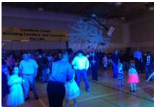
Baile de Padre/Hija