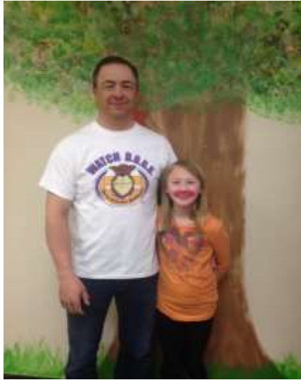
Papa Watch Dog